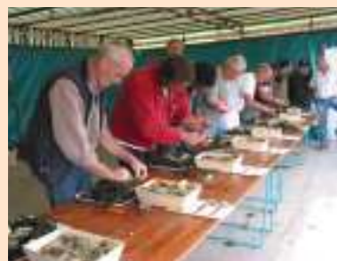
Fête de l'Huître

Notre Office qui emploie deux personnes à temps partiel toute l'année, deux personnes supplémentaires en été et quelques bénévoles, est une association « Loi 1901 » qui fonctionne avec les subventions de chaque commune, les recettes de vos adhésions, des visites guidées et des manifestations festives. Autres subventions, la CC3R finance les brochures touristiques, le site Internet et gère la publicité.