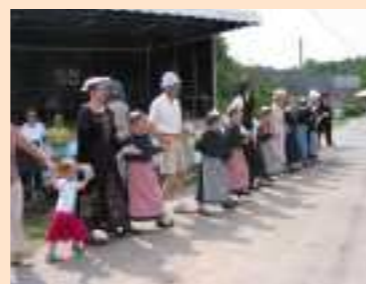
Fête du Pain