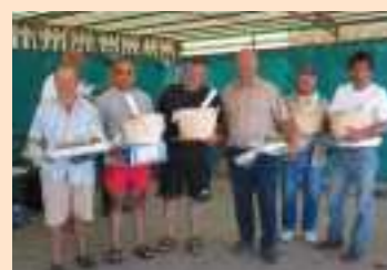
Concours des Ecaillers

Les travaux débuteront au cours du mois d'octobre.