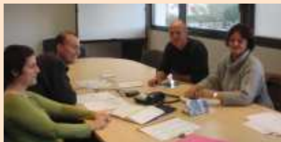
Réunion de préparation

L'équipe d'animation enfance CC3R vous présente le 1er Festival du Jeu le samedi 29 septembre 2007 de 14h à 19h sur le parking de la Trinitaine à St Philibert et sera ouvert à tout public et gratuit. Favorisant la mobilisation intergénérationnelle et associative par les pratiques du jeu, ce festival se déclinera