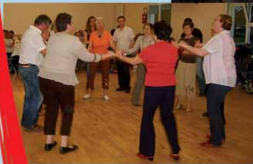
40 ans du Cercle Celtique : le 17 mai 2008.