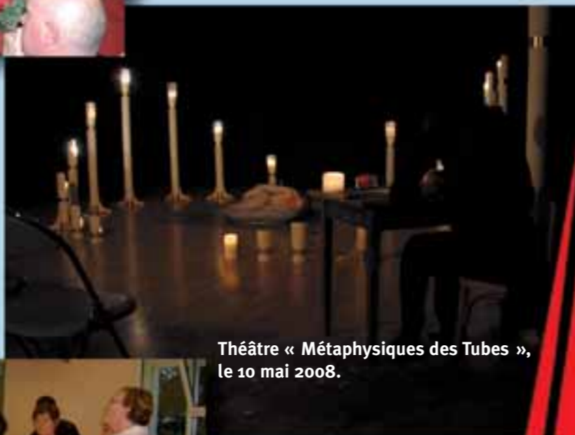
Théâtre « Métaphysiques des Tubes », le 10 mai 2008.