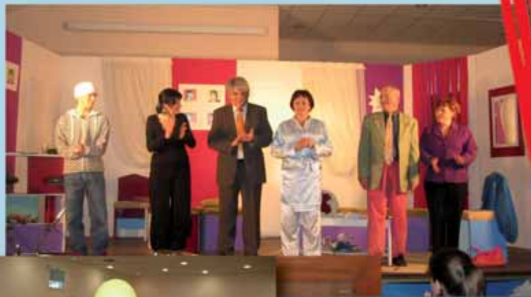
Théâtre « Dites-le avec des flirts » : le 29 mars 2008.