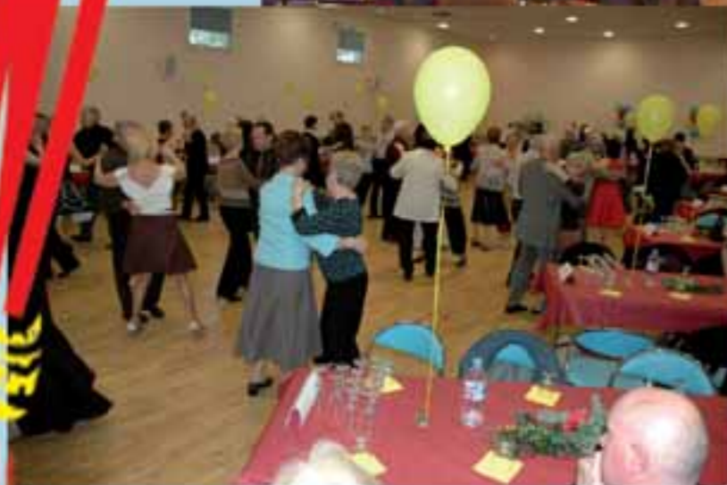
Plaisir de danser : le 19 avril 2008.