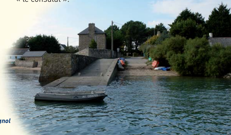
Cale du Fort Espagnol

Le coup d'état du 18 brumaire 1799 amène la mise en place d'un nouveau régime « le consulat ».