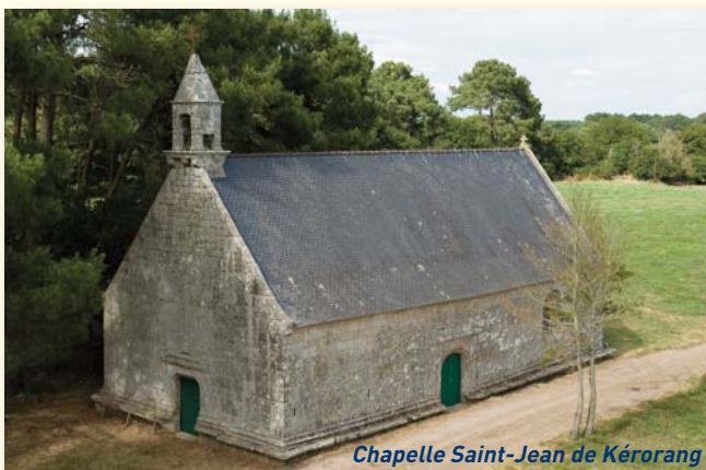
Chapelle Saint-Jean de Kérorang