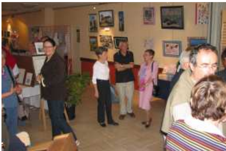
Le vernissage de l'expo

N'hésitez pas à vous faire connaître en mairie si vous souhaitez présenter une ou plusieurs de vos oeuvres en 2009.