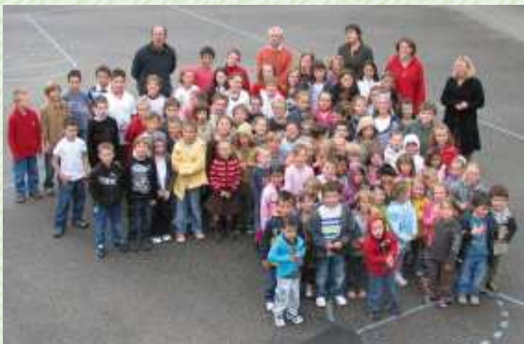
Ecole des Deux Rivières

La rentrée scolaire s'est effectuée dans les deux écoles, et les effectifs sont équivalents : 115 élèves dans chaque établissement.