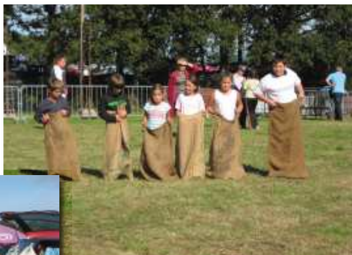
Les plus jeunes en action

Durant l'après-midi, une fête champêtre a eu lieu sur le site, avec divers jeux, démonstrations de travaux agricoles anciens (pressage du cidre à l'ancienne) et stands de casse-croûtes.