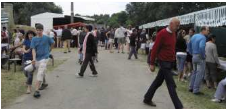
Animation autour du four.

Quel plaisir de se retrouver autour d'un four à pain, à attendre les fournées.