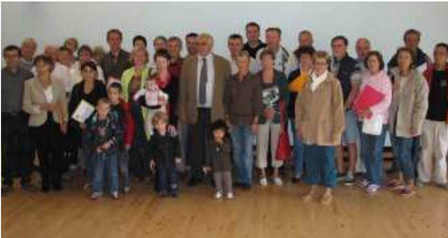
Les élus accueillent les nouveaux résidents

Selon les derniers chiffres de l'Insee, la population de Crac'h est estimée à 3218 habitants.