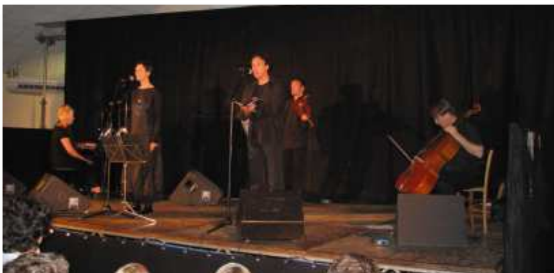
Les 6 musiciens en concert.