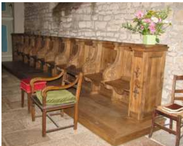
Les stalles rénovées

Les stalles du chœur de l'église Saint THURIAU étaient stockées, pour partie, dans les bras du transept et des éléments se trouvaient dans la sacristie.