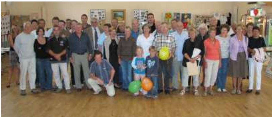
Forum : le rendez-vous des assos.

sées par les nombreuses associations de la commune, mais aussi de réfléchir à un investissement personnel dans l'une ou l'autre de ces associations. L'ambiance fut animée grâce au Cercle Celtique qui a dansé durant cette journée.