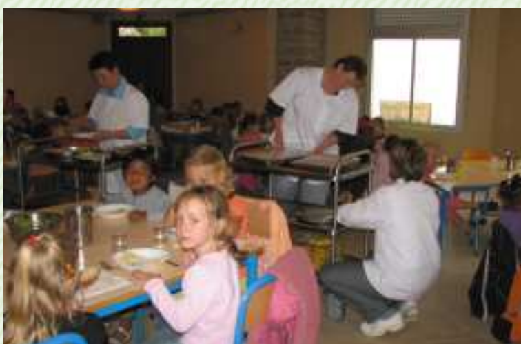
1er service à la cantine

A la cantine, pas de changement. Les deux services sont en place : 11h45 à 12h30 pour les maternelles et 12h30 à 13h20 pour les primaires.